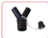
AC-AS1679 CONECTOR Y REDUCTOR 40-32 2 SALIDAS