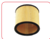
AC-AS2852 FILTRO CARTUCHO PARA X2-X3