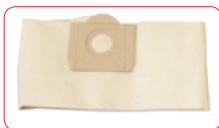
BOLSA DE PAPEL FILTRANTE AC-AS2875 PARA X2-X3