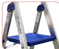
Plataforma de 26,5 x 26,5 cm fabricada en poliéster reforzado.